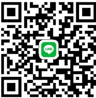
白リハ病院 2 階病棟