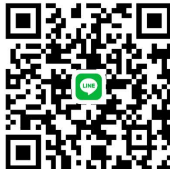
白リハ病院 5 階病棟