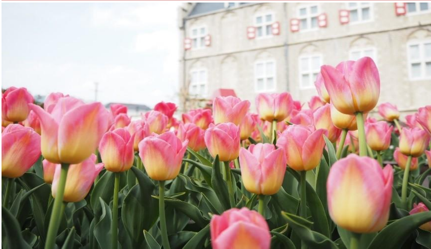
長崎県 ハウステンボス