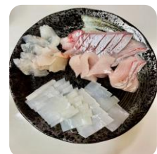
命に感謝♡いただきます